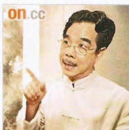
何百里如果唔係當年「頂頭槌」中招，都未必會專心畫畫。